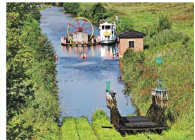
Flussmarsch der Biebrza (links), Jugendstil in Olsztyn (Mitte) und Oberländischer Kanal (rechts)