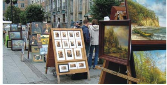
Altstadt von Danzig an der Motława mit dem Krantor (links) und Kunstmarkt in der Marienstraße

Gdańsk (464.000 Einw.): 997 erstmals urkundlich erwähnt, erlebte Danzig im 13. Jahrhundert seine erste große Blütezeit. Anfang des 14. Jahrhundert erhielt Danzig unter den Deutschrittern das Stadtrecht und trat 1361 der Hanse bei und konnte sich 1410 der Macht des Ordens entziehen und war 1457-1793 (Besetzung durch Preußen) de facto eine unabhängige Stadtrepublik und galt als reichste Stadt der Welt, weshalb sie den Beinamen „Königin der Ostsee“ erhielt. 1919-1939 war die Freie Stadt Danzig nach den Bestimmungen des Versailler Vertrags ein unabhängiger Staat. Der originalgetreue Wiederaufbau der im 2. Weltkrieg zerstörten Innenstadt ist ein Meisterwerk der polischen Handwerker und Restaurateure, das ihnen weltweiten Ruhm eintrug. 1970, 1976 und 1980 sorgte Danzig mit Streiks und Demonstrationen der Werftarbeiter erneut für internationale Schlagzeilen. Durch den Arbeiterführer und späteren Präsidenten Lech Wałęsa entstand mit der Solidarność die erste freie Arbeitergewerkschaft hinter dem Eisernen Vorhang.