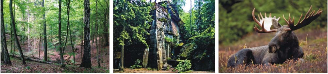
Mischwald auf einer Endmoräne (links) Bunker der Wolfsschanze (Mitte) und Elch im Biebrza-Nationalpark