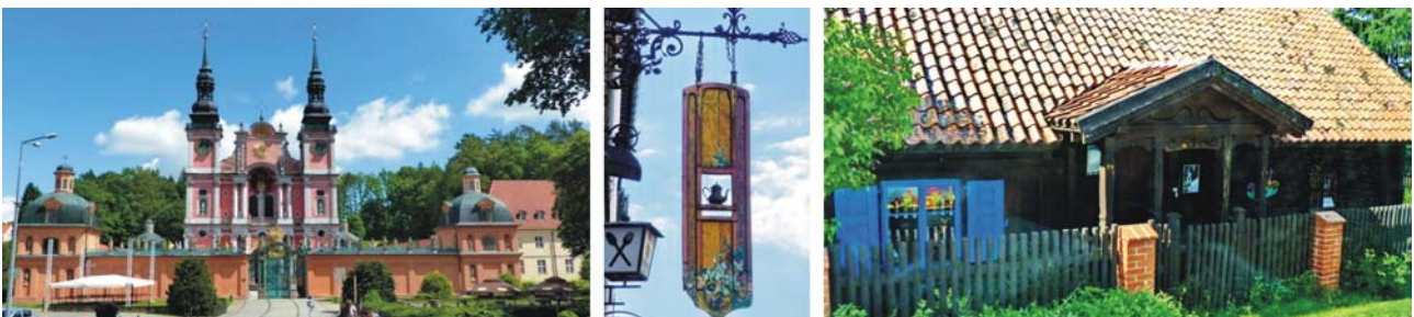
Barocke Basilika in Święta Lipka (links), Wirtshausschild (Mitte) und traditionelles, ländliches Wohnhaus in Wojnowo (rechts)

Święta Lipka: mit nur 173 Einwohnern wird die Kulisse des kleinen Dorfs Heiligelinde von einer dreischiffigen Basilika überragt. Sie entstand 1688-1693 auf sumpfigem Gelände. Die Ursprünge des Kults um Unserer Lieben Frau von Heilige Linde gehen auf eine Sage aus dem 14. Jh. zurück. Ein Verurteilter soll auf Intervention von Unserer Lieben Frau eine Holzfigur ihres Kindes angefertigt haben und nach Fertigstellung freigelassen worden sein. Die Skulptur hängte er an eine Linde worauf hin sich viele Wunder um die Statue des Marienkindes ereignet haben sollen.