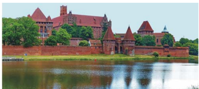
Wanderdüne im UNESCO-Biosphärenreserwat im Slowiński-Nationalpark bei Łeba (links) und Marienburg in Malbork (rechts)