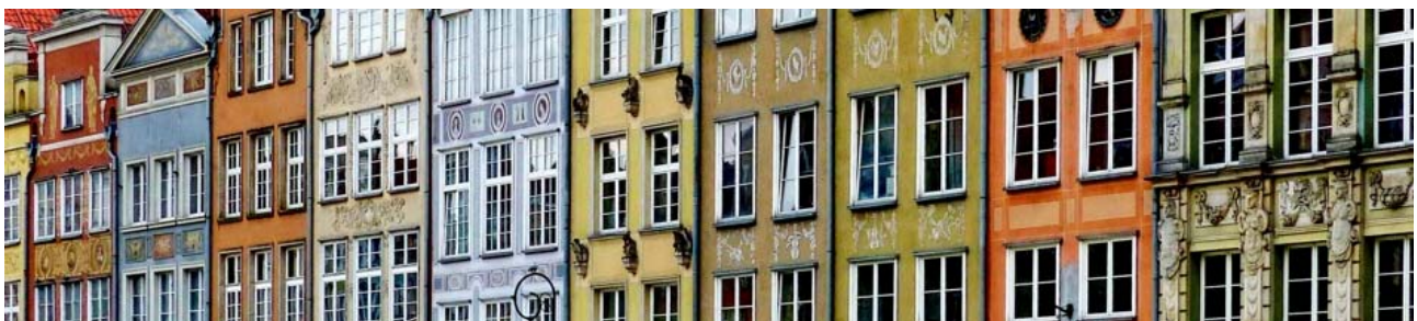
Häuserfassaden in der Altstadt von Danzig