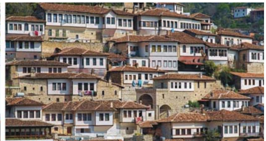
von links nach rechts: ausrangierte Diktatoren in einem Hinterhof, Moschee in Kruja, eng an den Berg geschmiegte Altstadt von Berat