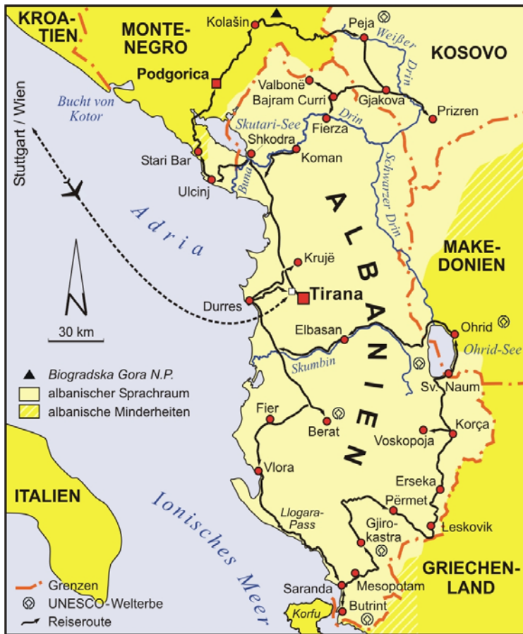
Karte mit Exkursionszielen und -route im Überblick