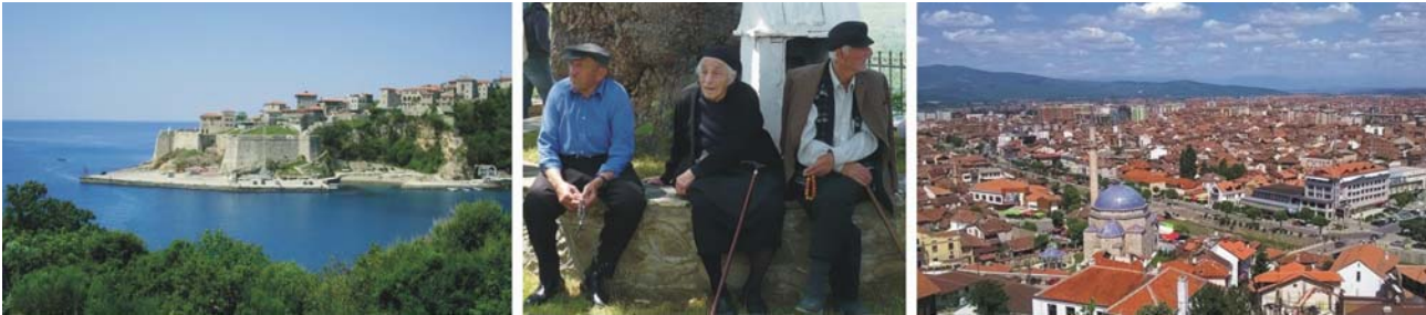
von links nach rechts: Ulcinj (Montenegro), Dorfleben, Prizren (Kosovo)

Unterkünfte: ***Hotel Čile in Kolašin / Montenegro (oder vergleichbar) ****Hotel Centrum in Prizren / Kosovo (oder vergleichbar)