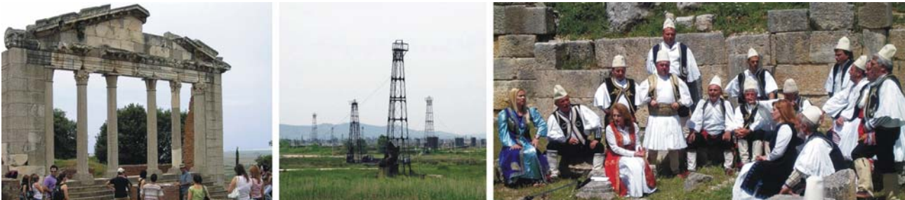
von links nach rechts: Ausgrabungsort Apollonia und Erdölfeld bei Fier, Folklore im römischen Theater von Bylis

Unterkünfte: **** Hotel Brillant in Saranda / Albanien (oder vergleichbar) *** Hotel Alvero in Permet / Albanien (oder vergleichbar) *** Pension Vila Falo in Voskopja / Albanien (oder vergleichbar)