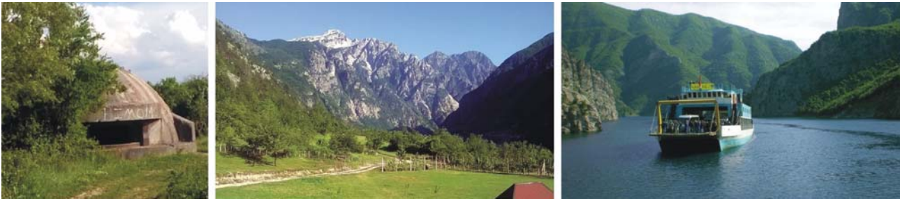
links nach rechts: im gesamten Land allgegenwärtig - Bunker aus der Zeit der Diktatur, ruhiges Tag in den Albanischen Alpen, Fähre auf der Drin

Unterkünfte: ***Hotel Margjeka in Valbona / Albanien (oder vergleichbar) ***Hotel Mangalemi (oder ****Hotel Grand White City) in Berat / Albanien