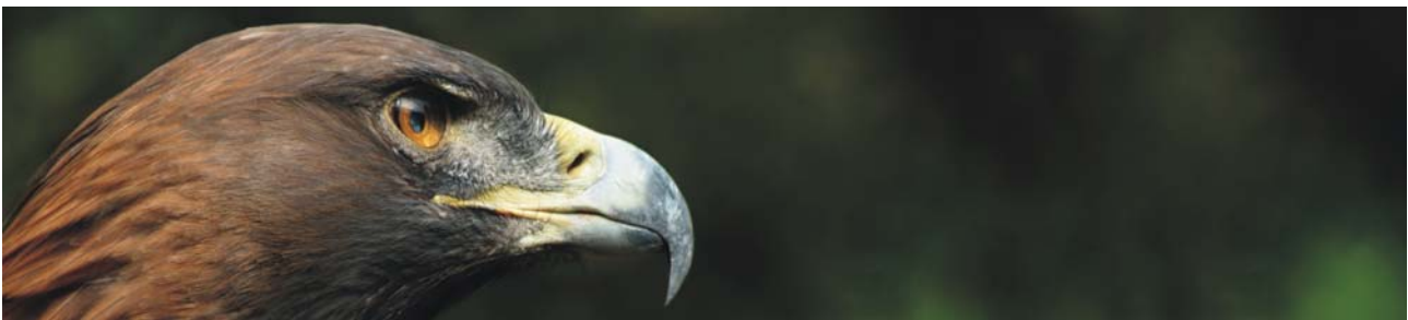
das albanische Wappentier: der Steinadler ( Aquila chryaetos )

Am Mittag Transfer zum Flughafen von Tirana und Rückflug nach Düsseldorf über Wien mit Austrian Airlines: Flug OS 848, Tirana-Wien 15:05-16:40 Uhr und Flug OS 155, Wien-Düsseldorf 17:40-19:15 Uhr.